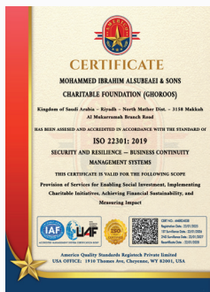
نظام إدارة استمرارية الأعمال (ISO 22301:2019)