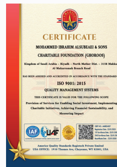
نظام إدارة الجودة (ISO 9001:2015)