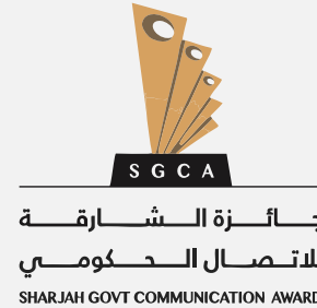
جائزة الشارقة للاتصال الحكومي SHARJAH GOVT COMMUNICATION AWARD 2024م