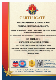
نظام إدارة المعرفة (ISO 30401:2018)