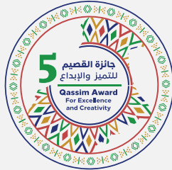
جائزة القصيم للتميز والإبداع (فئة التميز في القطاع غير الربحي) 2025م